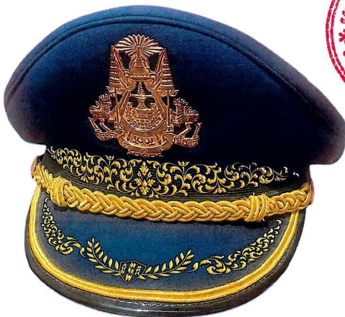
ថ្នាក់អគ្គនាយកទេ